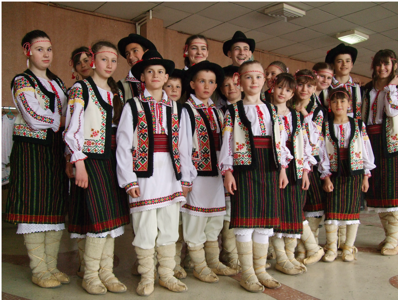
Tineri din raionul Ungheni

decorativ principal, împreună cu ornamentele suplimentare. Trebuie să recunoaștem faptul că meșterii, dar și toate persoanele care au confecționat ori mai fac măștișoare s-au străduit să valorifice toate formele geometrice pentru a modela aceste terminații, a le face cât mai atractive. Prezentăm în imaginile inserate în carte mai multe forme care ni s-au părut relevante, deși trebuie să recunoaștem, varietatea formelor este mult mai mare. Materialele din care sunt făcute măștișoarele le conferă o expresie aparte. Dacă acum câteva secole, era destul de complicat să obții lână de culoare roșie distinctă, cu ajutorul coloranților naturali, în prezent există o mare diversitate de lână, ață de bumbac sau de mătase, folosite la confecționarea măștișoarelor.