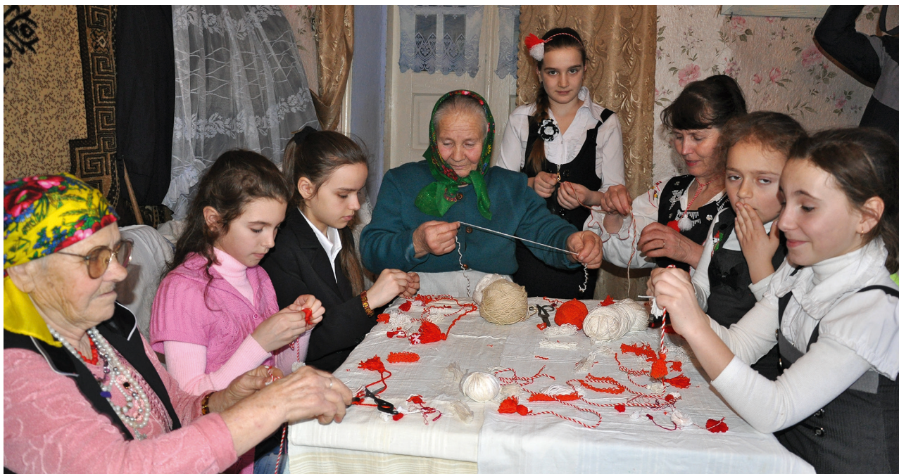
Confecționarea mărțișoarelor în satul Hârbovăț, Anenii Noi. 1 martie 2012

deloc neglijabil, esențial în a concepe scopuri, obiective, acțiuni, metode și principii de perpetuare a acestui patrimoniu în timp. Aceste instrumente esențiale își găsesc rezonanță cu cele utilizate de către țările vecine, în special de România 1 .