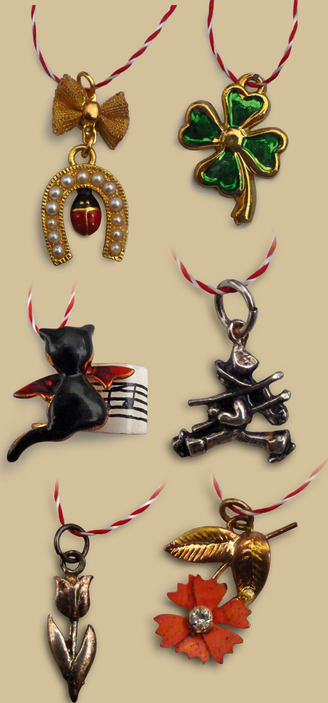
Padantive pentru mărtișoare. Din colecția autorului

Cea de-a doua cale de aprovizionare cu mărtișoare o oferea comerțul de stat. Mărtișoarele din comerț