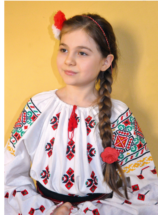
Copiii poartă mărțișoarele ca străbunii lor

Întâi martie avea valoare de omen , asemeni zilei de Crăciun și celei de Anul Nou. Oamenii din sate făceau curățenie generală în case și în gospodărie. Scoteau afară din casă țesăturile și hainele, aerisindu-le. Strigau, mai în glumă, mai în serios: „Mart în casă, puricii afară!” Ardeau gunoiul adunat, imitau lucrările agricole. „Când ajungeam la întâi mart, se chema că asta-i Odochia, Baba Odochia. Dimineața ne sculam și începem 12 lucruri, ca la Crășiun. Și prin casă, și pe-afară. Săpam, greblam, sășeram, îmblășeam. Măturam prin casă, să se ducă puricii afară. Cum numai era luna nouă pe șer, crai nou, ieșă bărbatu afară și striga spri casă de trei ori: „Lună nouă în casă / Purișii afară!” 14 . Puricele este cel mai mic reprezentant al necurăteniei umane și al sedentarismului iernii. Alungarea lui din casă este egală cu alungarea iernii.