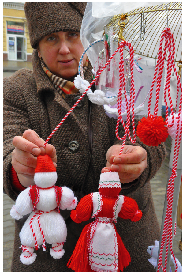
Măștișoarelor antropomorfe pentru casă sau oficiu